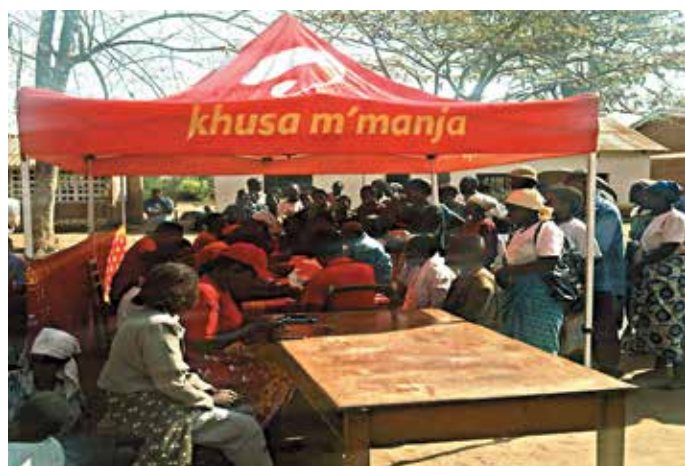
Transfert d'argent par téléphone mobile aux bénéficiaires dans un camp du PAM au Malawi, en Afrique